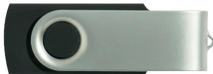
Bodyfarbe: Standard Schwarz