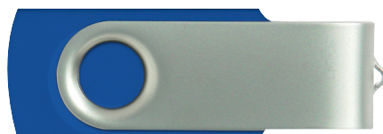
Bodyfarbe: Standard Blau Farbton ähnlich Pantone 287 (kann leicht variieren)