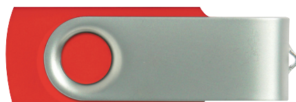
Bodyfarbe: Standard Rot Farbton ähnlich Pantone 1795 (kann leicht variieren)